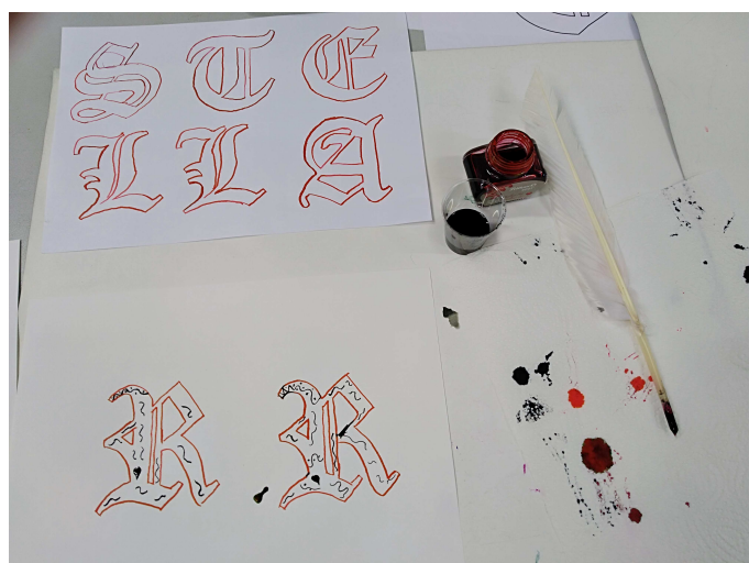
Mit Feder und Tinte schreiben wir wie im Mittelalter.